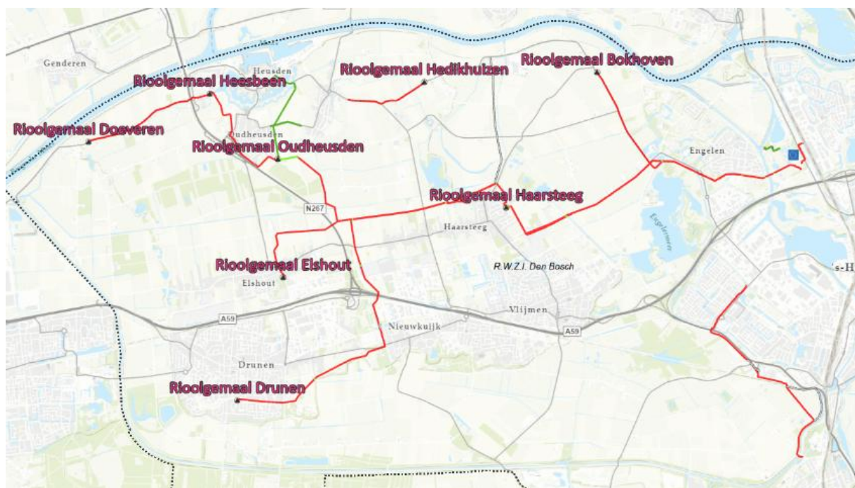
Figuur 1; Rioelstelsel gemeente Heusden (waterschapsdeel) het blauwe vierkant betreft RWZI 's-Hertogenbosch.

Op rioelgemaal Haarsteeg komen drie rioelgemalen uit van het waterschap; Drunen, Elshout en Oudheusden. Vanaf deze gemalen is het eerste deel van de leidingen een persleiding; kleinere diameter buis met hogere druk en daardoor een stroomsnelheid van meerdere km/uur. Vanuit Vlijmen/Nieuwkuijk komt een gemeentelijke vrij vervalleiding aan op gemaal Haarsteeg, en er is nog een kleine vrij vervalleiding aan vanuit Haarsteeg zelf en de Tuinbouwweg. Een vrij vervalleiding kenmerkt zich door een continu, lager debiet en zeker bij droog weer een lage stroomsnelheid. Inschatting is dat de gemeentelijke leidingen 30% van het debiet op rioelgemaal Haarsteeg geven, en de drie waterschaps-rioelgemalen 70%.